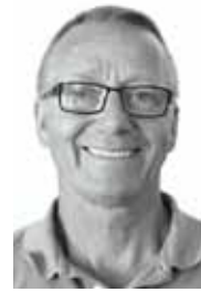
Ole Brockdorff Arkitekt maa